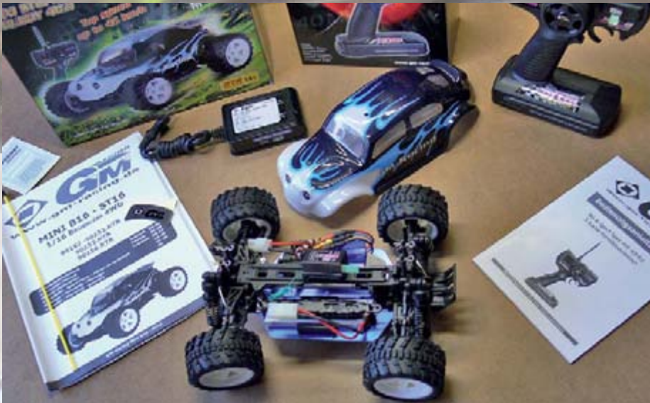
Der Baukasteninhalt ist bis auf 8 AA Batterien für den Sender komplett