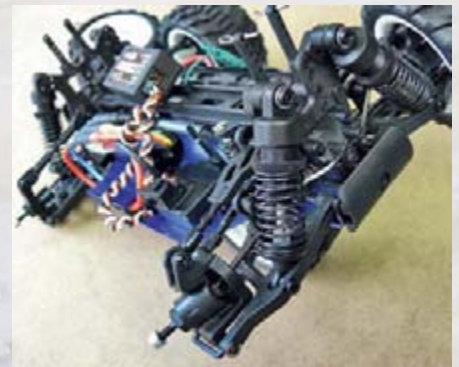
Die stabile Vorderachsaufhängung des Mini ST16 Baja mit oberen Querlenkern aus Rechts/Links-Gewindestangen