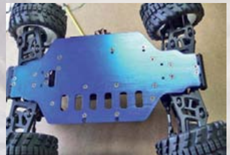
Von unten: Die eloxierte Chassisplatte, natürlich mit versenkten Schrauben

Die beiliegende GM XG-6 Sport Spec 40 MHz FM-Fernbedienung hat digitale Trimmungen. Die Servowege können umgepolt und der Weg des Lenkservos kann über diese Funke begrenzt werden. Die Fernbedienung ist nach Einlegen der 8 AA Batterien sofort startklar. Auch der Baja ist nach dem Einsetzen und Anschließen des geladenen Lipo-Akkus sofort bereit. Ein Programmieren des Reglers war beim Testmodell nicht nötig.